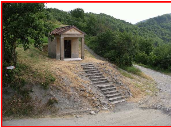
La cappelletta della Santissima Trinità

Stazione di Arquata Scrivia Autolinee Arfea 0131-445433 E-mail: arfea@interbusiness.it