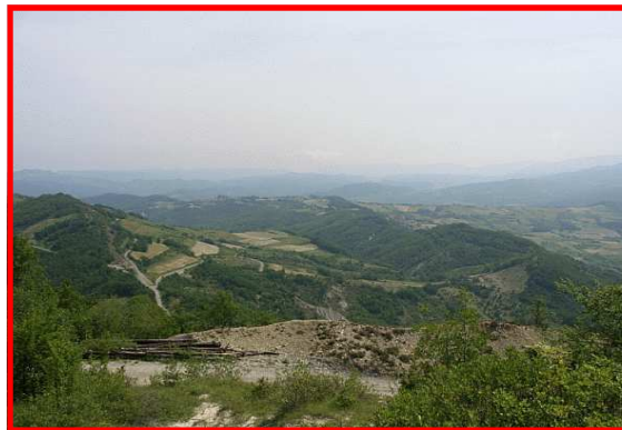
Panorama dalla forcella

Il Servizio Parchi individua i sentieri più significativi degli 8 settori al fine di promuovere forme di turismo a basso impatto ambientale e una migliore conoscenza del nostro territorio.